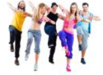
- ฐานความรู้ ปรับเปลี่ยนพฤติกรรม 4 ฐาน