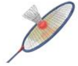
แบดมินตัน