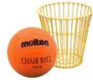
แชร์บอลหญิง