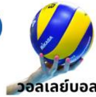
วอลเลย์บอล