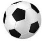
ฟุตบอลชาย